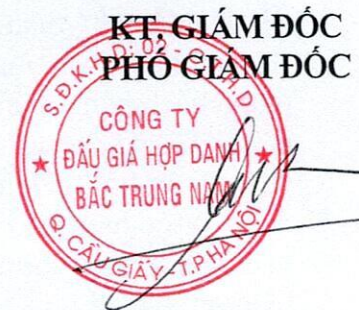
Đinh Đăng Dung