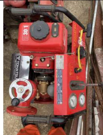
Bơm chữa cháy di động