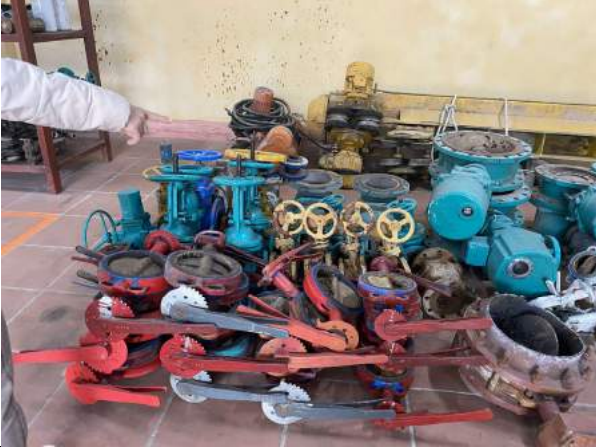
Van bướm các loại