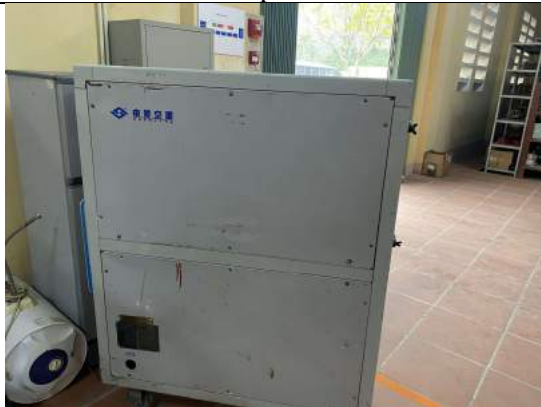
Máy hút âm