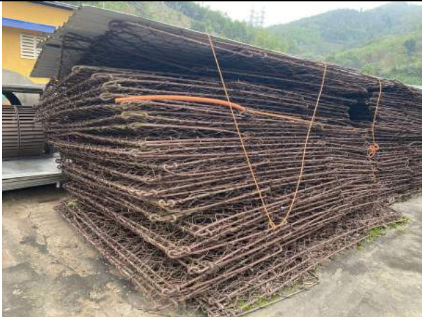
Sắt thép phế liệu