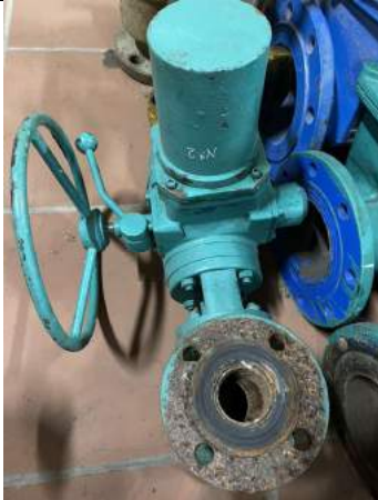
Van cổng DN 50 PN10 điều khiển bằng điện