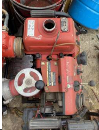
Bơm xăng cứu hỏa