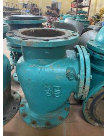
Van cổng Dn250