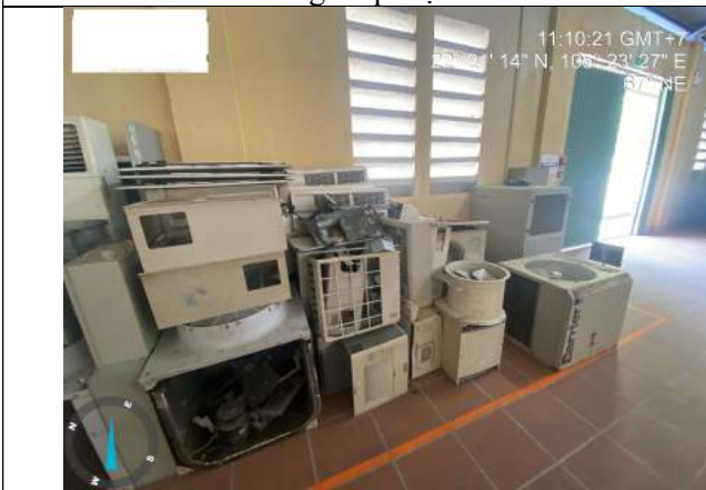
Điều hòa đã bóc tách (không có lốc)