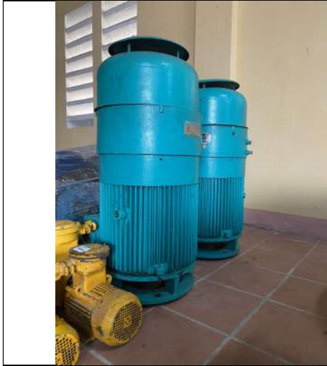
Bơm trực đứng dẫn điện YBL 280 (Phần Động cơ)