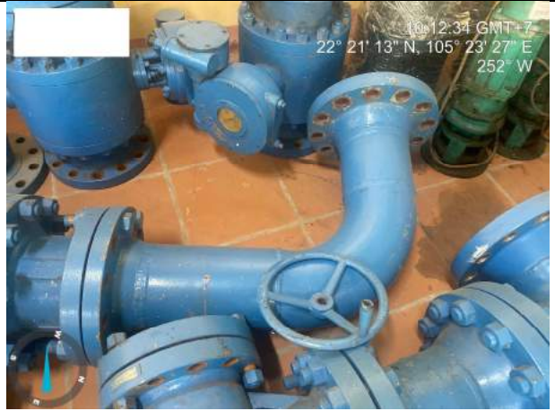
Đường ống thép trắng