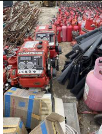
Sắt thép phế liệu, Bình chữa cháy, bơm cứu hỏa