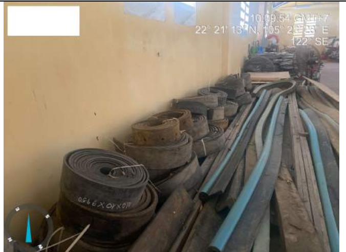
Gioăng cao su