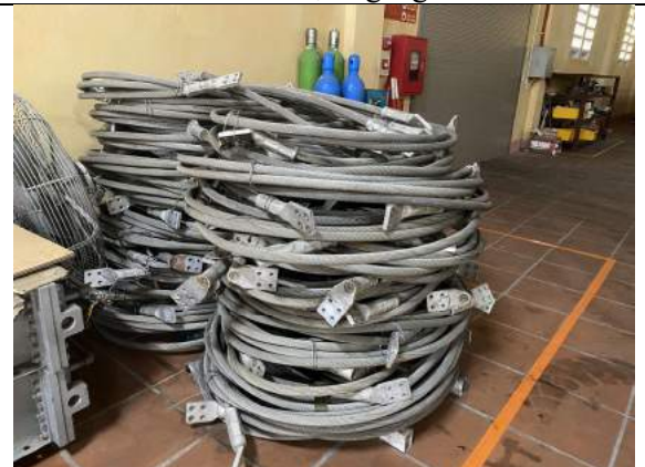
Dây dẫn nhôm lõi thép ACSR50064 + Có đầu cốt