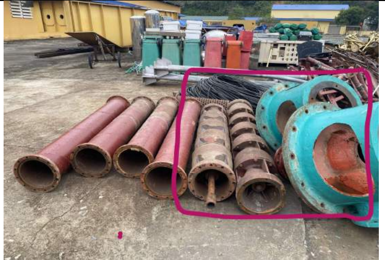
Bơm trực đứng dẫn điện YBL 280-4-4 (Phần Bơm, trổ bơm)