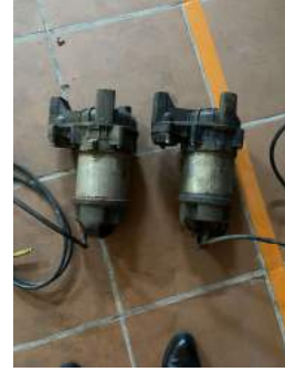
Bơm chìm nước thải sinh hoạt; công suất 0,25kW