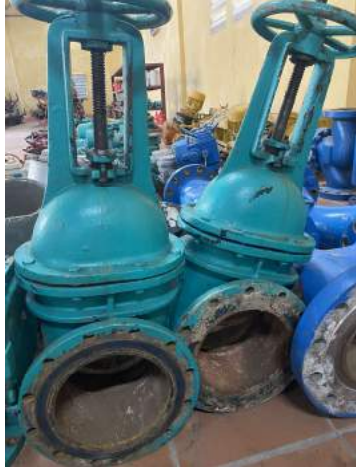
Van cổng Dn250.