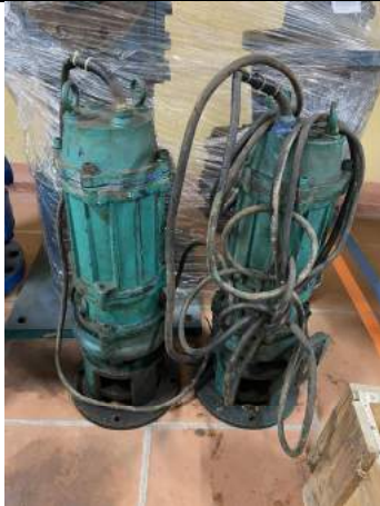
Bơm chìm vét nước nắp tua bin 506 YWQ1-30