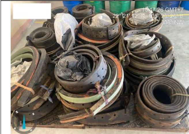
Gioăng cao su