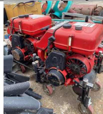
Bơm chữa cháy di động