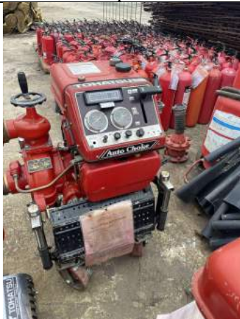
Bơm chữa cháy di động + Bình cứu hỏa