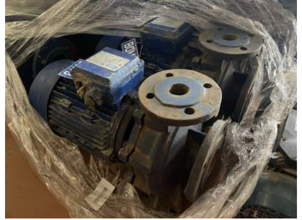
Bơm trục ngang