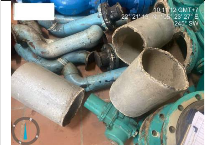
Ống thép mạ kẽm