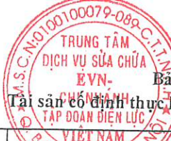
Bảng 1 Tài sản cố định thực hiện thanh lý năm 2022