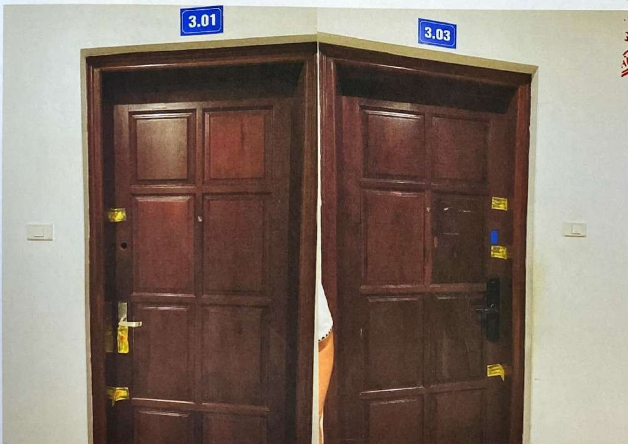
Hình ảnh Căn hộ số số 3.01 (A 03.1) và Căn hộ số số 3.03 (C303) sau khi niêm phong