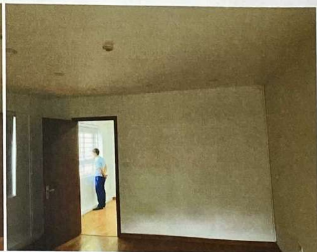
Hình ảnh hiện trạng Căn hộ số 3.03 (C303), tại tầng 03, Tòa nhà CT1- VIMECO, phường Trung Hòa, quận Cầu Giấy, thành phố Hà Nội trước khi bàn giao.