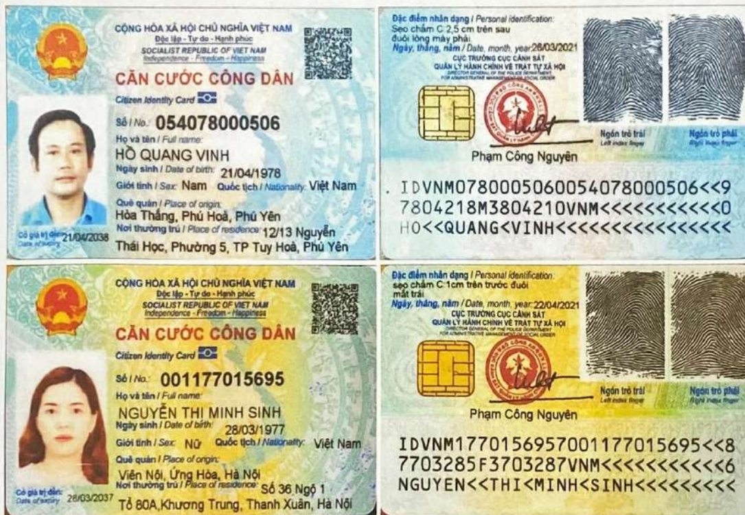
Hình ảnh “Chứng minh nhân dân/Căn cước công dân” do người yêu cầu lập vi bằng, người tham gia lập vi bằng cung cấp

(Kèm theo vi bằng số: 465/2022/VB-TPLHD ngày 08 tháng 09 năm 2022)