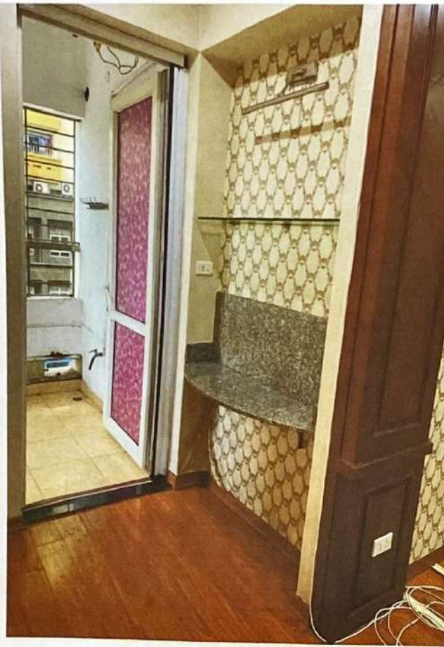
Hình ảnh hiện trạng Căn hộ số số 3.01 (A 03.1), tại tầng 03, Tòa nhà CT1- VIMECO, phường Trung Hòa, quận Cầu Giấy, thành phố Hà Nội trước khi bàn giao.