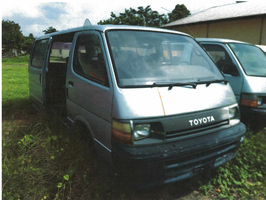
HÌNH 11: TÌNH TRẠNG CÁC XE KHÁCH HIỆU TOYOTA