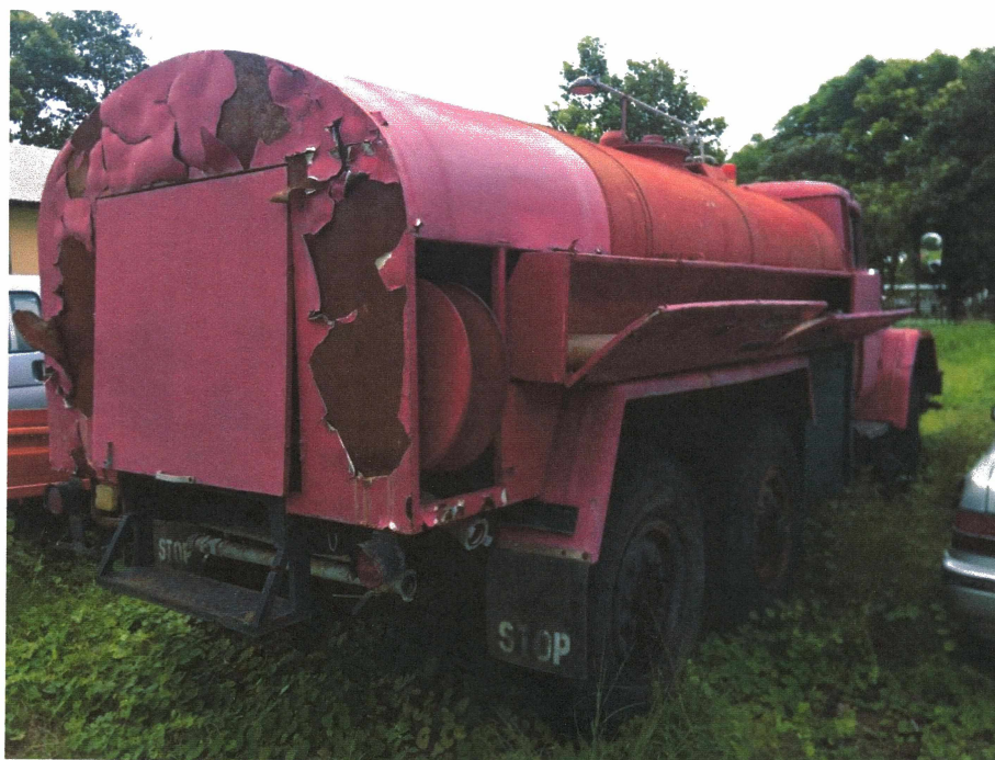
HÌNH 16: TÌNH TRẠNG XE TẢI HIỆU ZIL