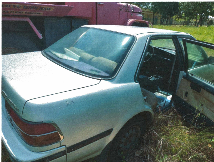
HÌNH 19: TÌNH TRẠNG XE CON TOYOTA COROLLA.