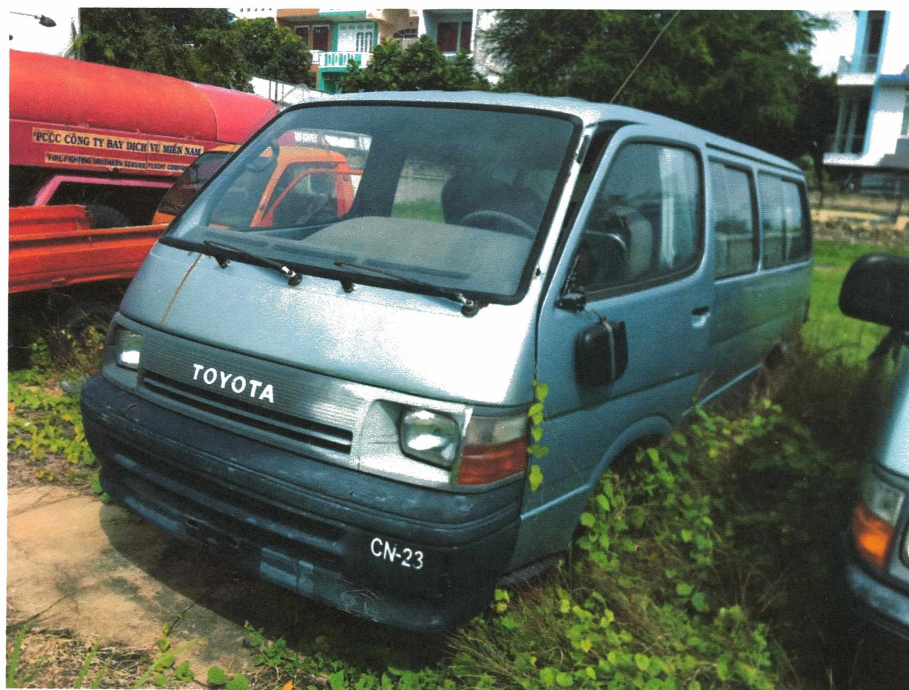
HÌNH 10: TÌNH TRẠNG CÁC XE KHÁCH HIỆU TOYOTA.