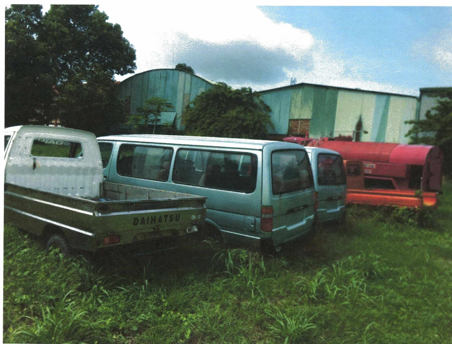
HÌNH 22: TÌNH TRẠNG XE TẢI HIỆU DAIHATSU 1,5 TẤN.