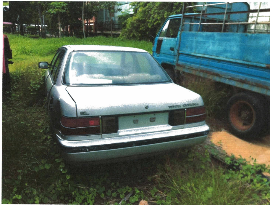
HÌNH 18: TÌNH TRẠNG XE CON TOYOTA COROLLA.