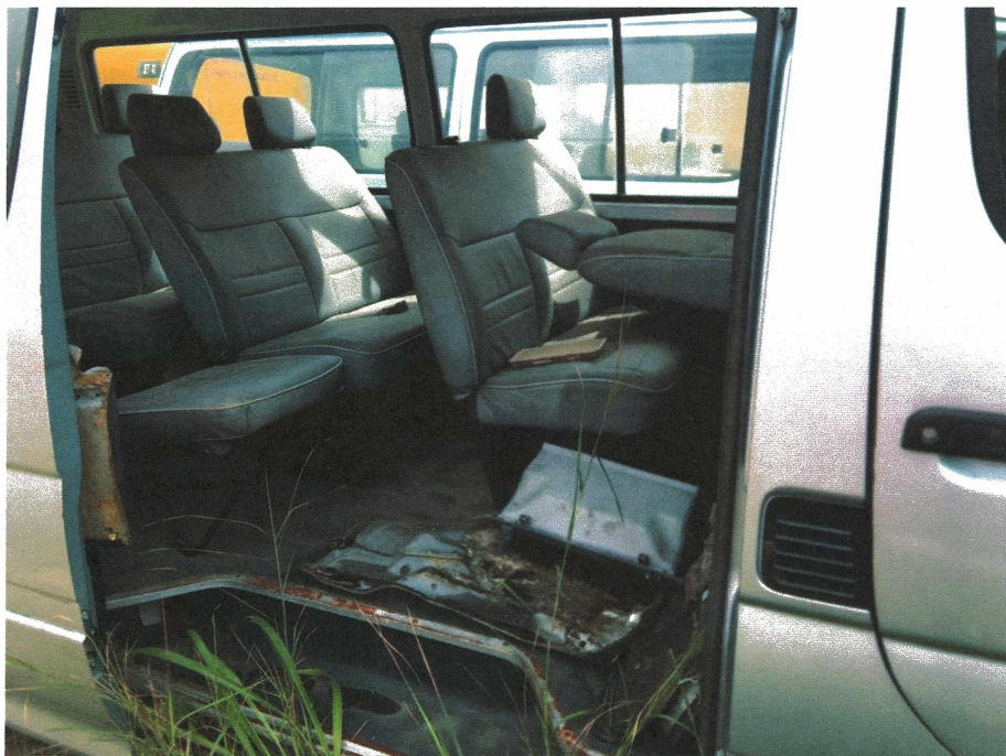
HÌNH 12: TÌNH TRẠNG CÁC XE KHÁCH HIỆU TOYOTA