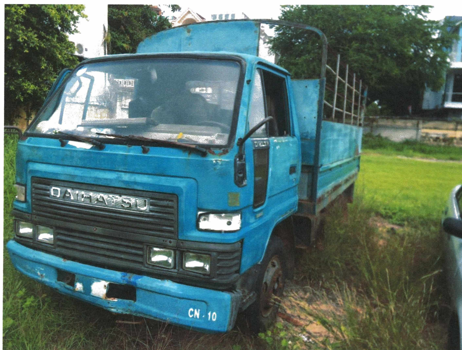
HÌNH 24: TÌNH TRẠNG XE TẢI HIỆU DAIHATSU 2,5 TẤN.