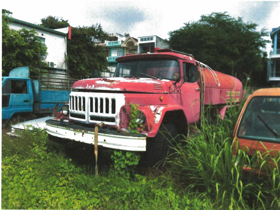
HÌNH 14: TÌNH TRẠNG XE TẢI HIỆU ZIL.