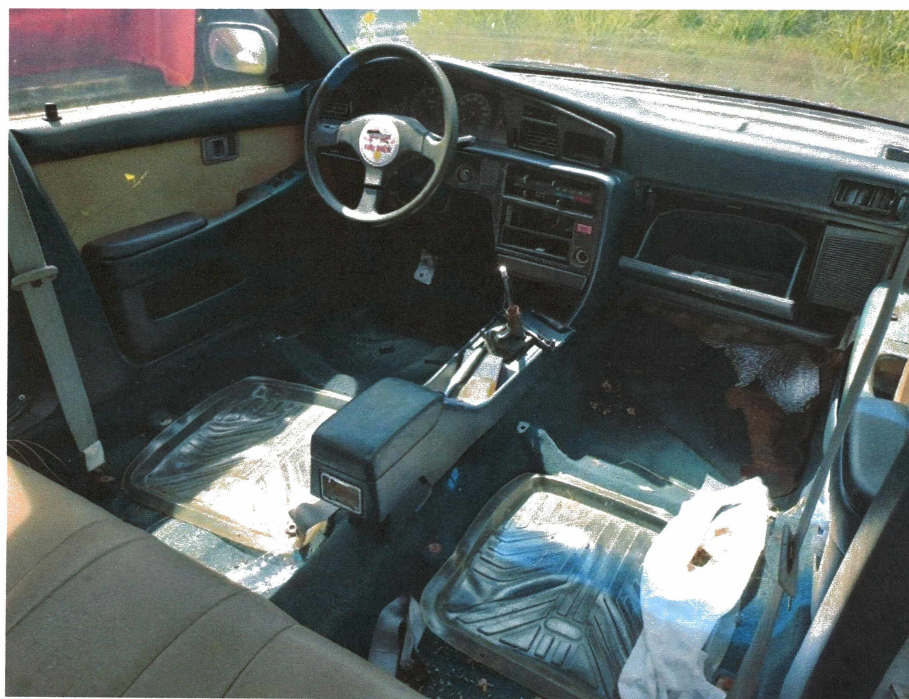
HÌNH 20: TÌNH TRẠNG XE CON TOYOTA COROLLA.