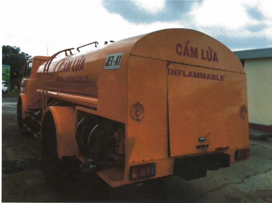
HÌNH 05: TÌNH TRẠNG CÁC XE TẢI BƠM TRẠ NẠP DẦU.