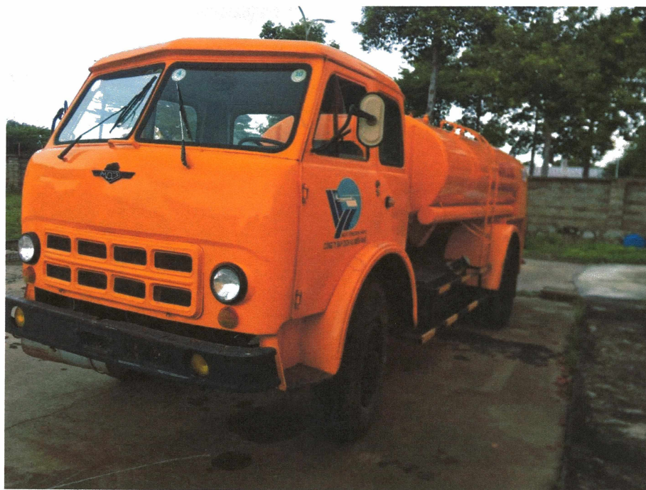
HÌNH 04: TÌNH TRẠNG CÁC XE TẢI BƠM TRA NẠP DẦU