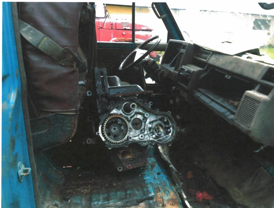
HÌNH 26: TÌNH TRẠNG XE TẢI HIỆU DAIHATSU 2,5 TẤN.