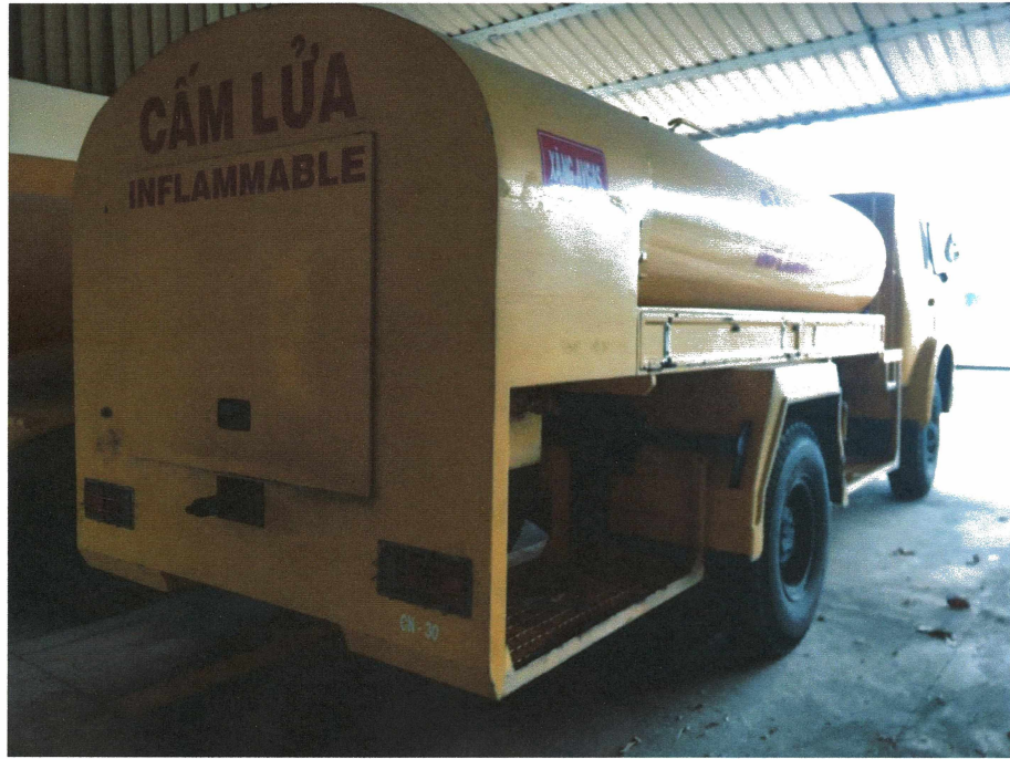
HÌNH 7: TÌNH TRẠNG CÁC XE TẢI BƠM TRA NẠP DẦU.