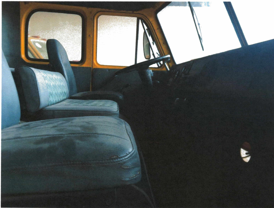
HÌNH 8: TÌNH TRẠNG CÁC XE TẢI BƠM TRA NẠP DẦU.