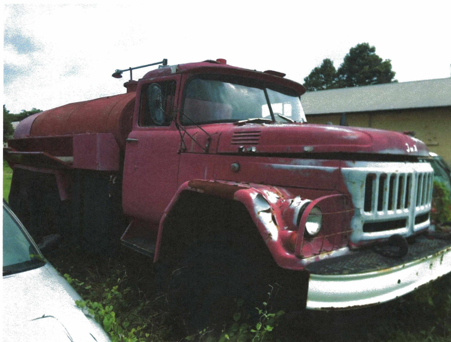
HÌNH 15: TÌNH TRẠNG XE TẢI HIỆU ZIL