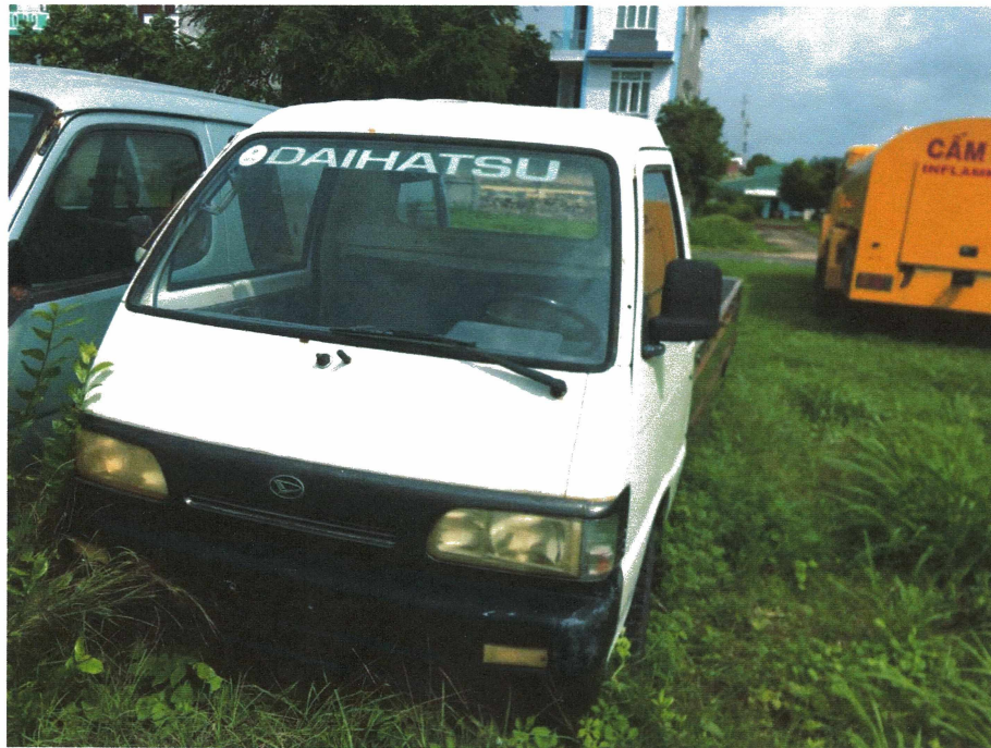
HÌNH 21: TÌNH TRẠNG XE TẢI HIỆU DAIHATSU 1,5 TẤN.