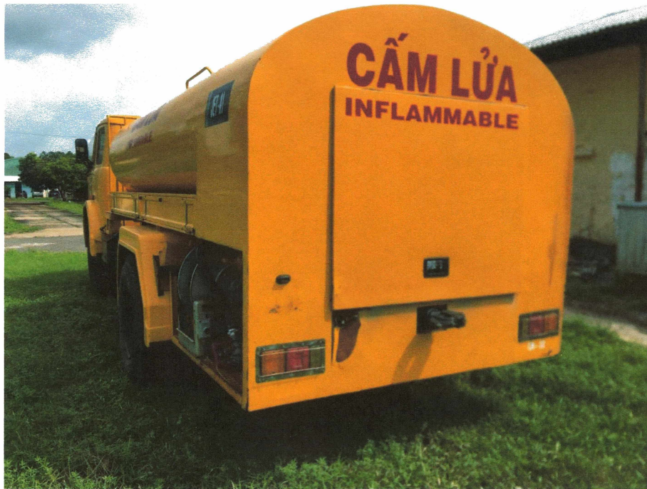
HÌNH 1: TÌNH TRẠNG CÁC XE TẢI BƠM TRÁ NẠP DẦU.

Địa điểm TĐ : Bãi xe Chi nhánh TCT Trục thẳng Việt Nam – Công ty TNHH - Công ty Trục thẳng Miền Nam.