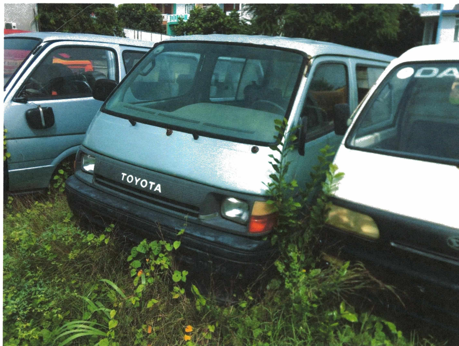
HÌNH 09: TÌNH TRẠNG CÁC XE KHÁCH HIỆU TOYOTA