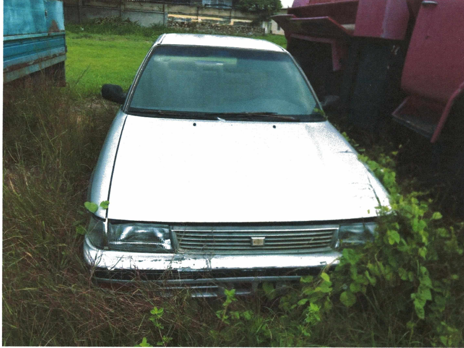
HÌNH 17: TÌNH TRẠNG XE CON TOYOTA COROLLA.