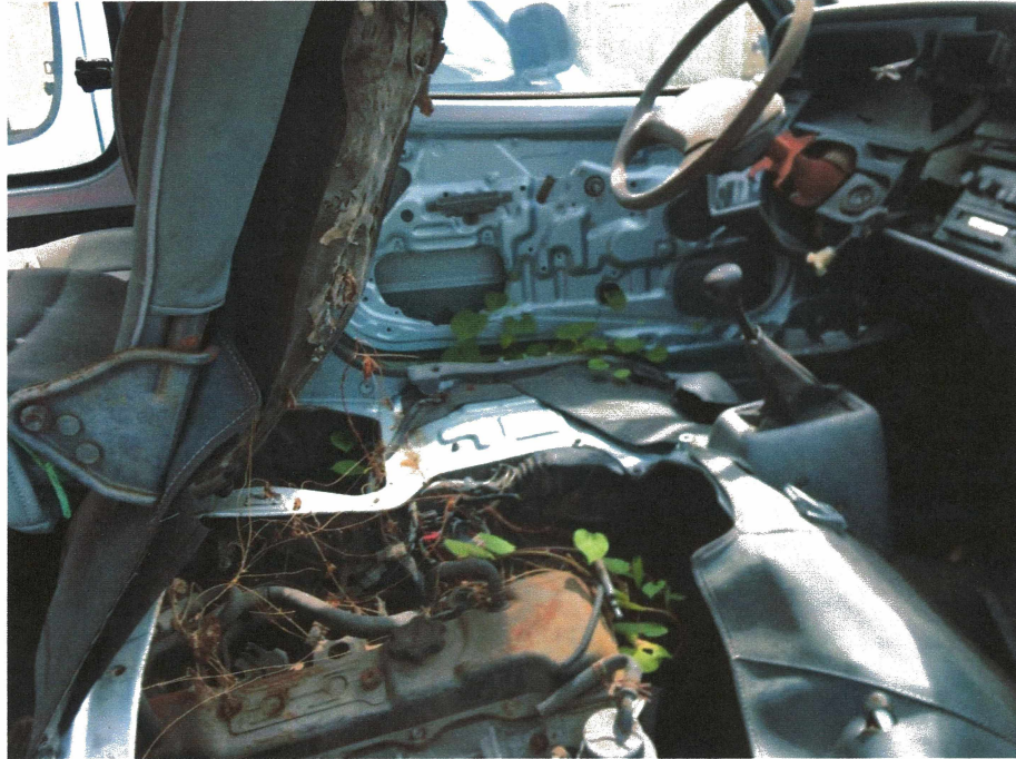
HÌNH 13: TÌNH TRẠNG CÁC XE KHÁCH HIỆU TOYOTA.