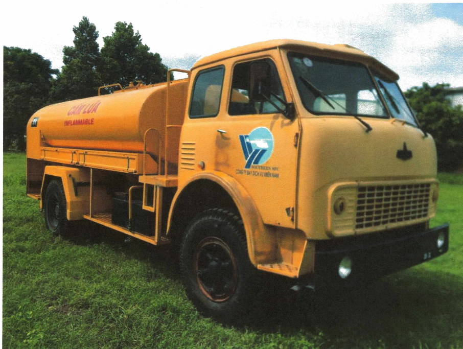
HÌNH 2: TÌNH TRẠNG CÁC XE TẢI BƠM TRÁ NẠP DẦU