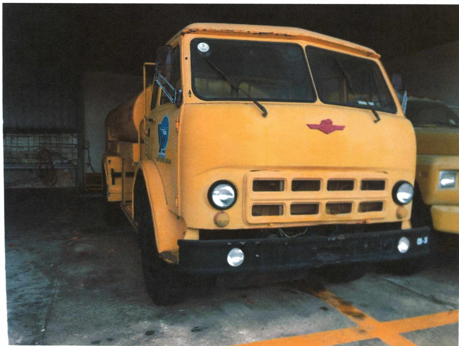
HÌNH 06: TÌNH TRẠNG CÁC XE TẢI BƠM TRẠ NẠP DẦU.