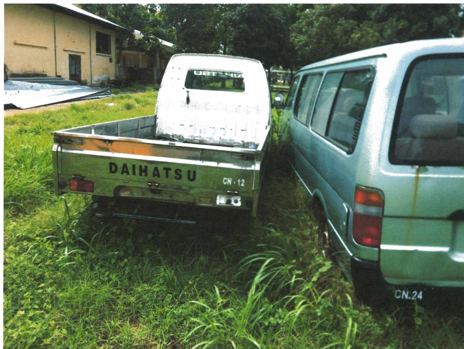
HÌNH 23: TÌNH TRẠNG XE TẢI HIỆU DAIHATSU 1,5 TẤN.